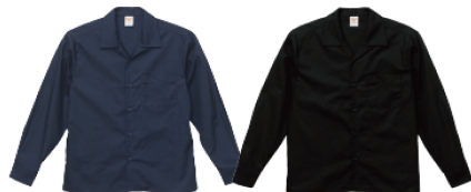
717 ダーク ネイビー