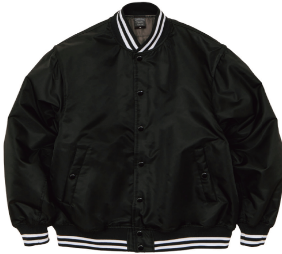
2001 ブラック/ ホワイト