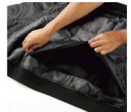
裾を開閉 (加工用ファスナー)